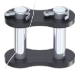
Eslabón de unión con pasadores REF : 008