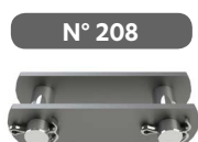
Maillon de jonction goupillé