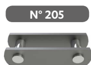
Maillon extérieur à river