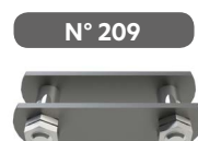
Maillon de jonction à écrous